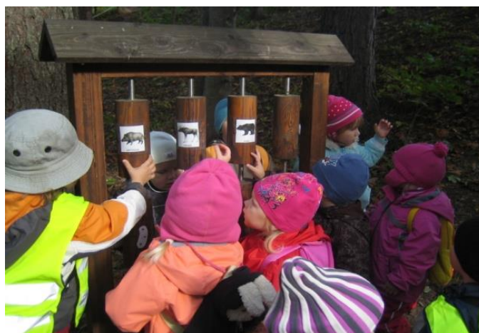
Lapsed loodus- ja õpperajal

Loodus on kinkinud koolimaja kõrvale ilusa Marjamäe koos oruga, kuhu on kogu koolipere ja õpilasmaleva ühisel jõul ning Keskkonnainvesteeringute Keskuse toel ehitatud loodus- ja õuesõpperada. Seal saab läbi viia nii koolitunde kui ka vabal ajal lõõgastuda.