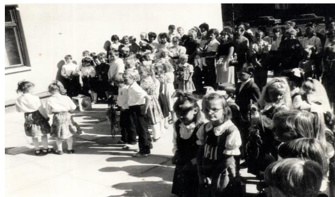
Õpilased 1. septembri aktusel 1991. a