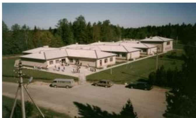
Melliste Algkool-Lasteaed algusaegadel